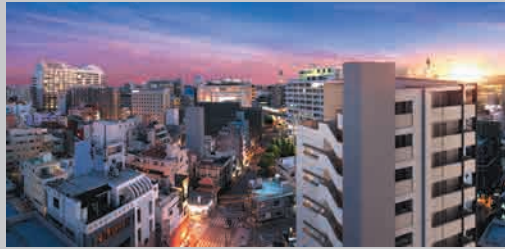
【完成予想図】※この絵図は図面を基に描き起こしたもので実際とは多少異なります。

コンパクトな空間ながら容量豊富な玄関収納や 屋外に設置したトランクルームの活用でスッキリした暮らしを。